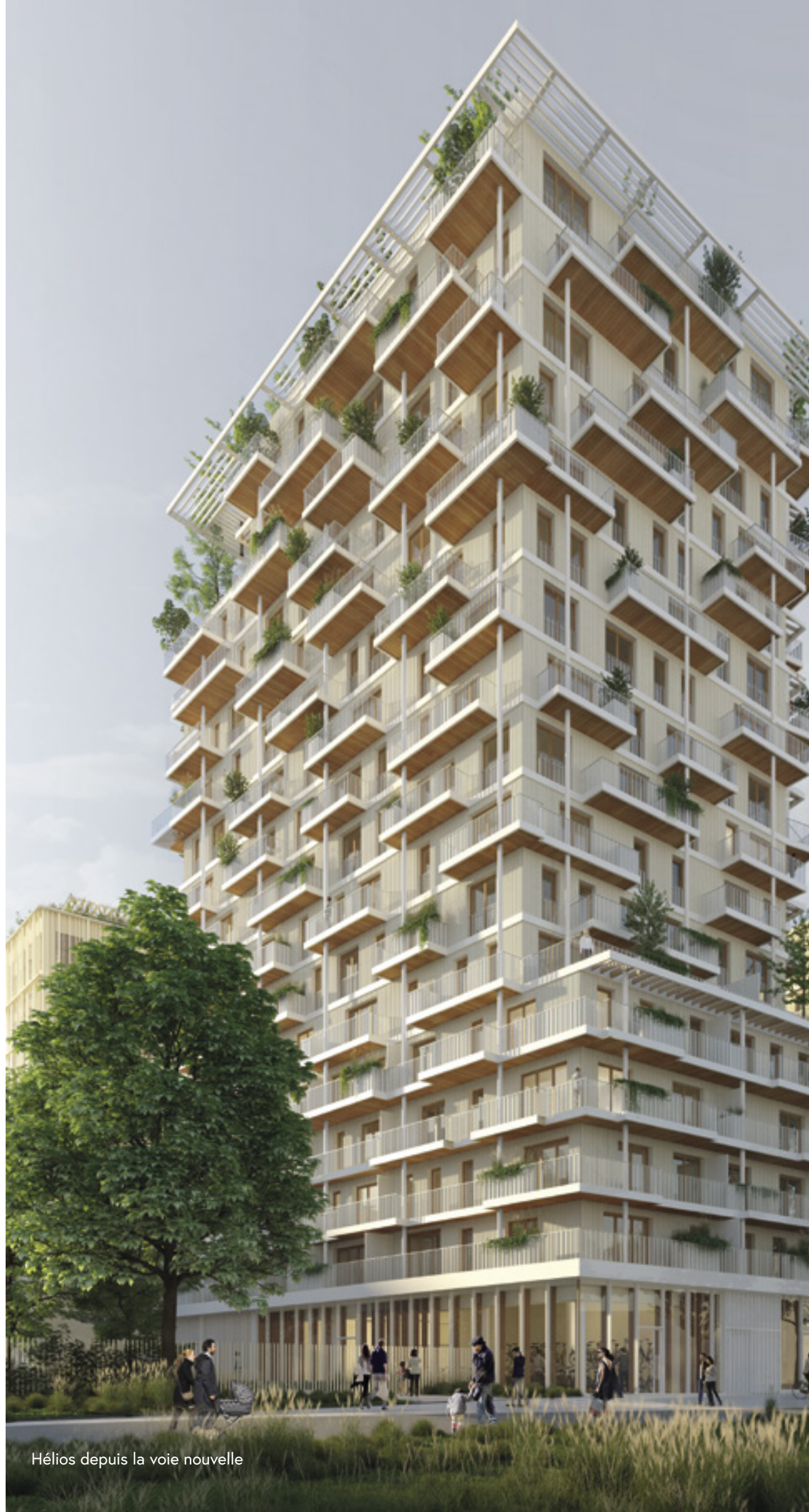
Hélios depuis la voie nouvelle