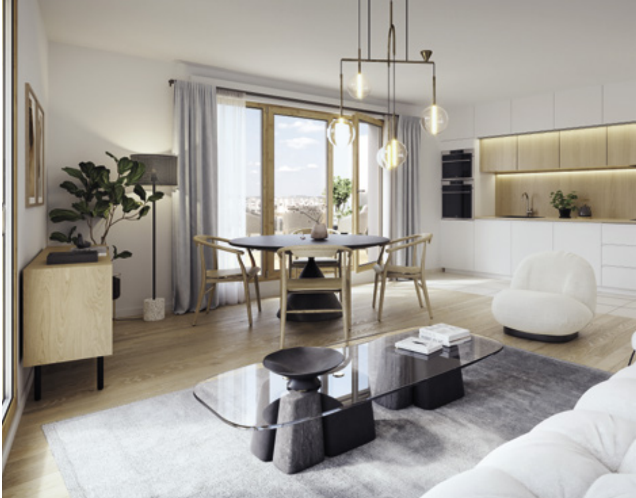
Appartement 506 : 4 pièces au 5 e étage