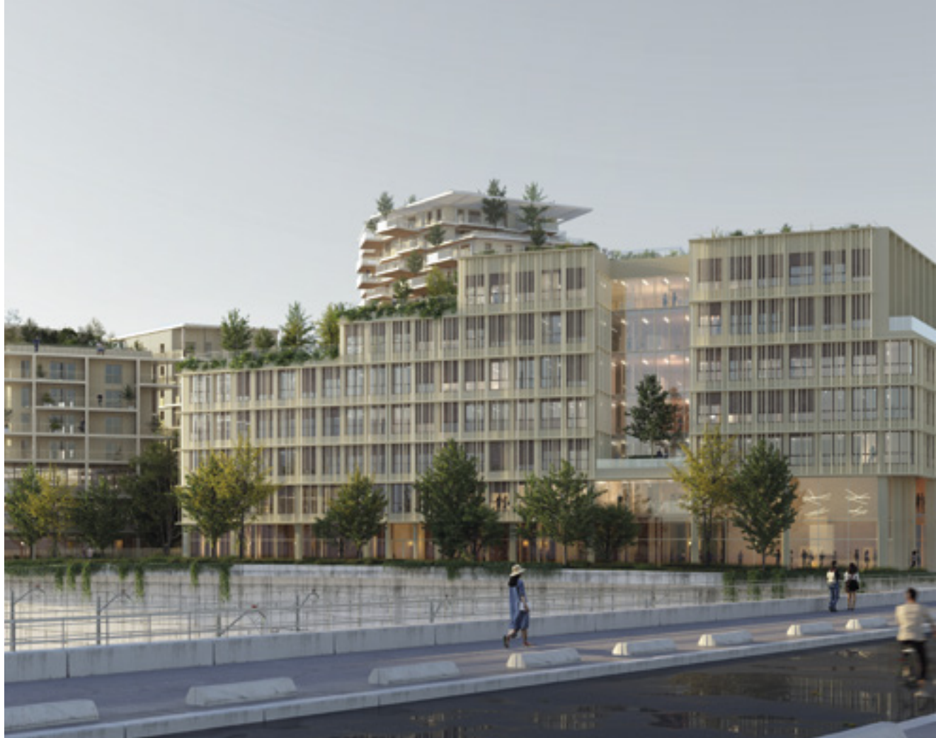
Vue sur l'école d'enseignement supérieur depuis le pont Hébert