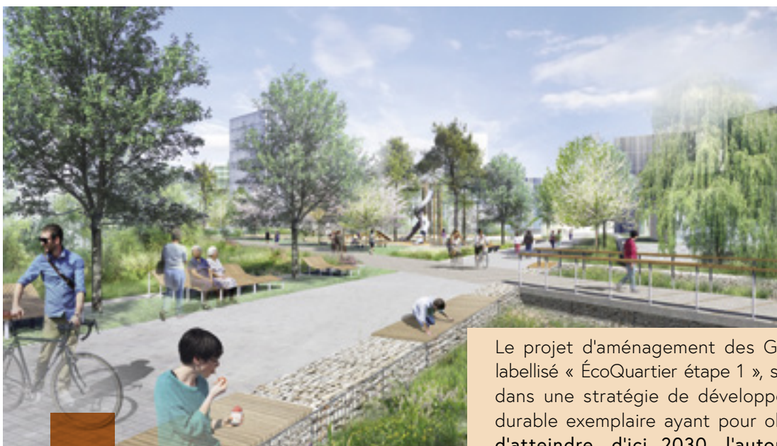
Cœur du Jardin des Rails