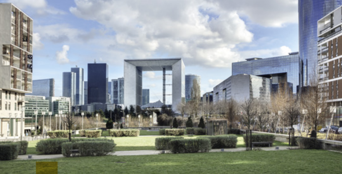
Grande Arche de La Défense