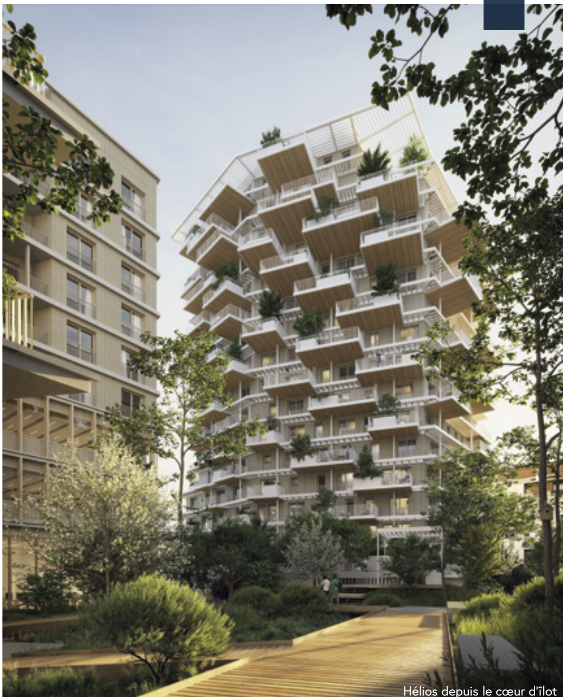
Hélios depuis le cœur d'îlot

Les jardinières disposées le long des balcons et le jardin d'ornement situé sur le toit offrent toute l'année un agréable spectacle de verdure. Pommiers, sureaux, fusains, sauge, verveine, chèvrefeuille, clématite... Cette composition paysagère diversifiée mêlant arbres, plantes grimpantes et parterres de vivaces réduit l'exposition aux vents pour un plus grand confort, tout en dessinant un véritable paysage suspendu.