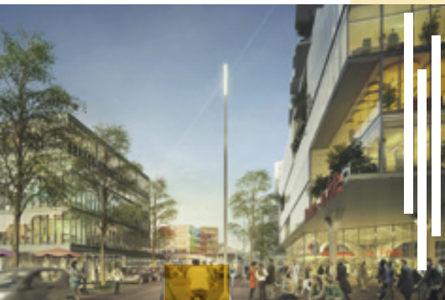
Rue de la Garenne secteur Pôle Gare