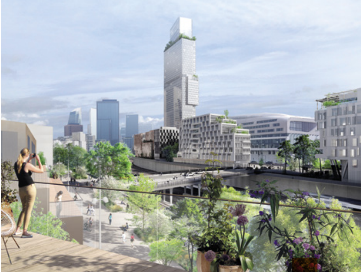
Vue depuis une opération voisine sur la gare RER vers le pont Hébert